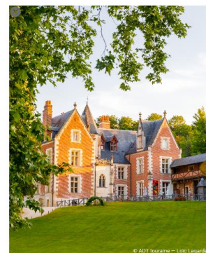
Château du Clos Lucé - Parc Léonardo Da Vinci

Habité par Léonard de Vinci lors des trois dernières années de sa vie, la demeure a été restituée comme au temps du génie italien. Elle abrite 40 inventions et le jardin expose 20 machines géantes à tester.