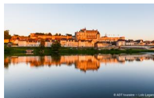
Château Royal d'Amboise

Pure beauté de la Renaissance, sublimée par ses jardins à la française, c'est un château de charme qui doit tout aux femmes ! Bâti par Katherine Briçonnet, embelli par Diane de Poitiers et Catherine de Médicis, sauvé de la Révolution par Madame Dupin... il mérite le nom que lui a donné l'Histoire : Le « Château des Dames » . Une brochure vous guidera dans votre parcours.